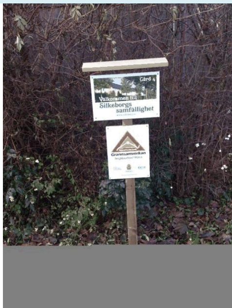
Ett bra exempel på att informera om att de boende har grannsamverkan.